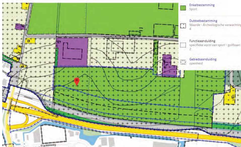
Figuur 0-4: Uitsnede van het bestemmingsplan 'Buitengebied 2012'

De huidige bestemming van het projectgebied waar het grondlichaam is voorzien, is 'sport' volgens het bestemmingsplan 'Buitengebied 2012' (vastgesteld 09-10-2012). Daarnaast geldt de functieaanduiding 'specifieke vorm van sport – golfbaan 2'. De gronden zijn bestemd voor de aanleg van een golfbaan, inclusief bijbehorende aanleg van wallen en waterelementen. Ter plaatse van het projectgebied gelden de dubbelbestemmingen 'Waarde – Archeologische verwachting 1, 2, 3 en 4'. Daarnaast is de gebiedsaanduiding 'openheid' hier van toepassing en is ten zuiden van het projectgebied de functieaanduiding 'geluidwal' van toepassing. Met betrekking tot de regels is ook het 'reparatieplan Bestemmingsplan Buitengebied 2014' (vastgesteld 21-05-2014) van belang. Dit komt omdat het bestemmingsplan 'Buitengebied 2012' destijds deels is vernietigd en naar aanleiding daarvan deze correctieve herziening is opgesteld.