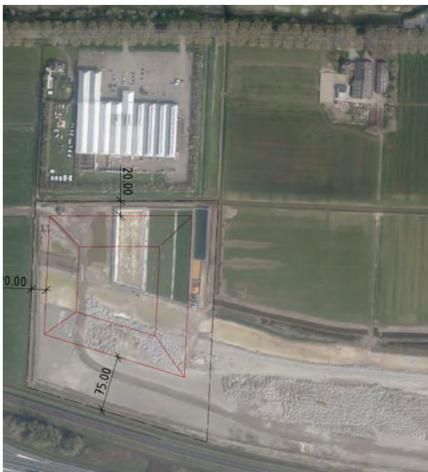
Figuur 0-2 Indicatie grondbeslag grondlichaam (rood)

In figuur 2-2 op de volgende pagina wordt het grondbeslag van de voorgenomen ontwikkeling indicatief weergegeven. De hoogte van het grondlichaam zal ongeveer 15 meter bedragen. Het grondlichaam opent de mogelijkheden voor verschillende activiteiten op het terrein zoals recreatie en evenementen en leent zich hierdoor voor meerdere doeleinden. Het grondlichaam wordt op passende wijze ingepast in het landschap. Hiertoe wordt een landschappelijke studie uitgevoerd.