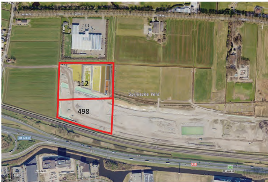
Figuur 0-1: Kadastrale percelen waarbinnen het zoekgebied voor het grondlichaam zich bevindt